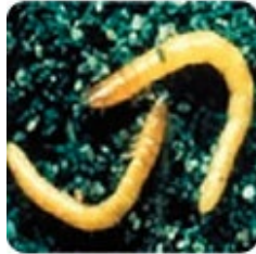
Larves de taupin