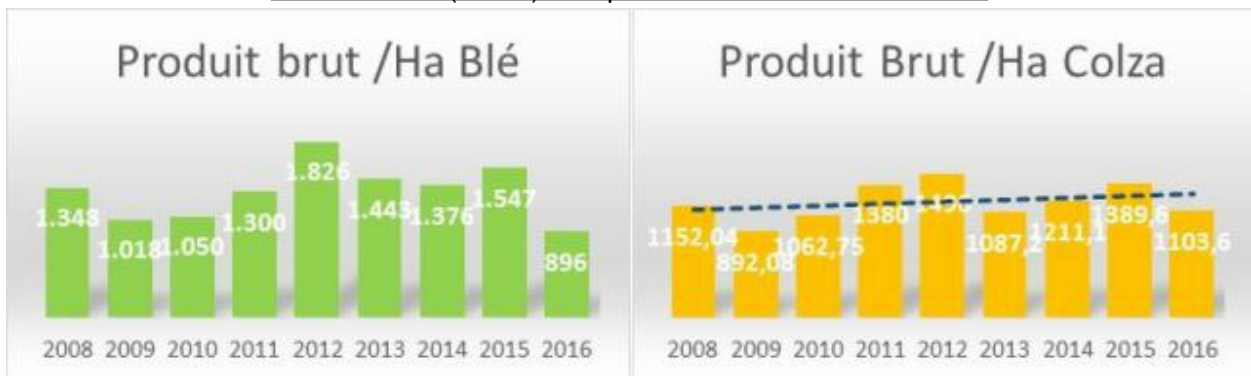
Produit brut (€/ Ha) comparé entre le blé et le colza.